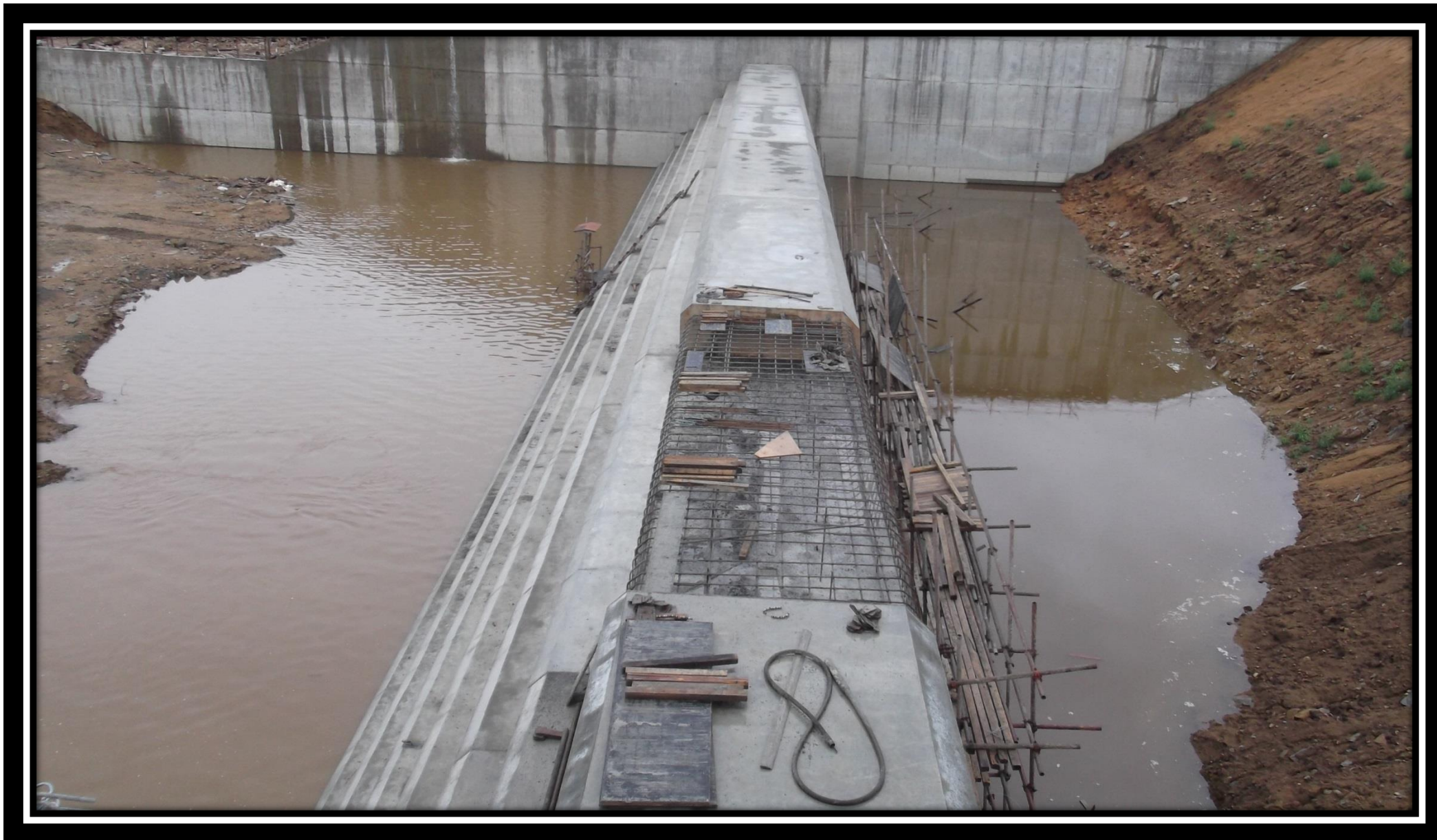
Первая секция переливной плотины