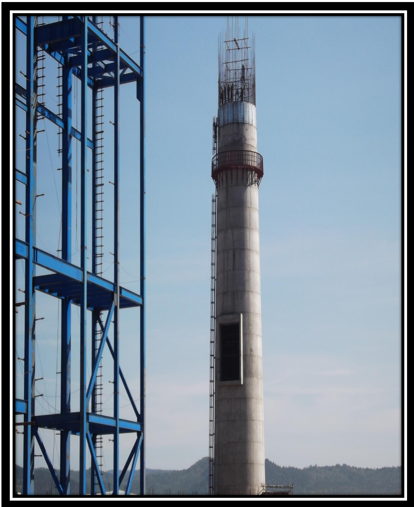
Дымовая труба 30.06.18 г.