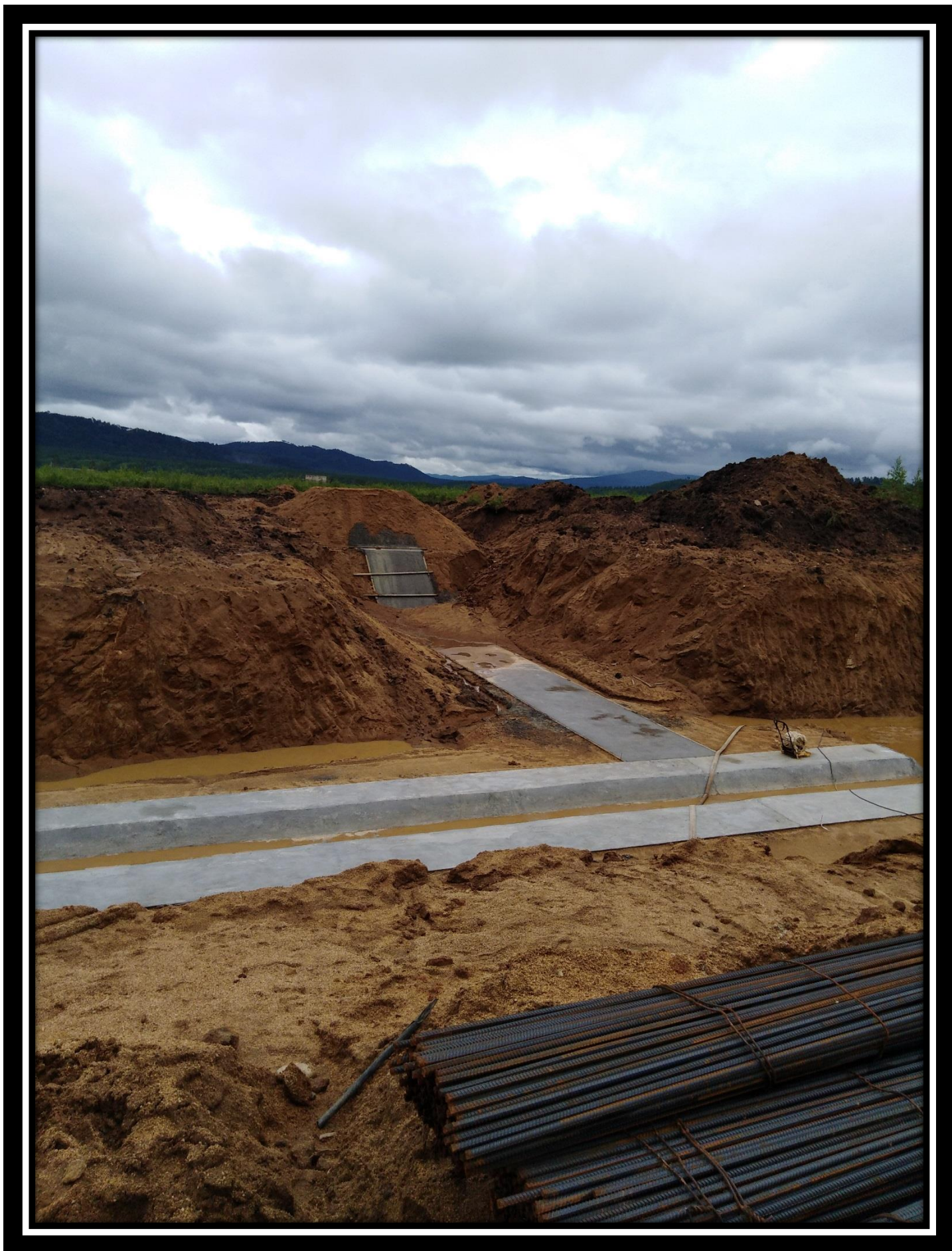
Фундамент выгрузного устройства щепы 30.06.18 г.