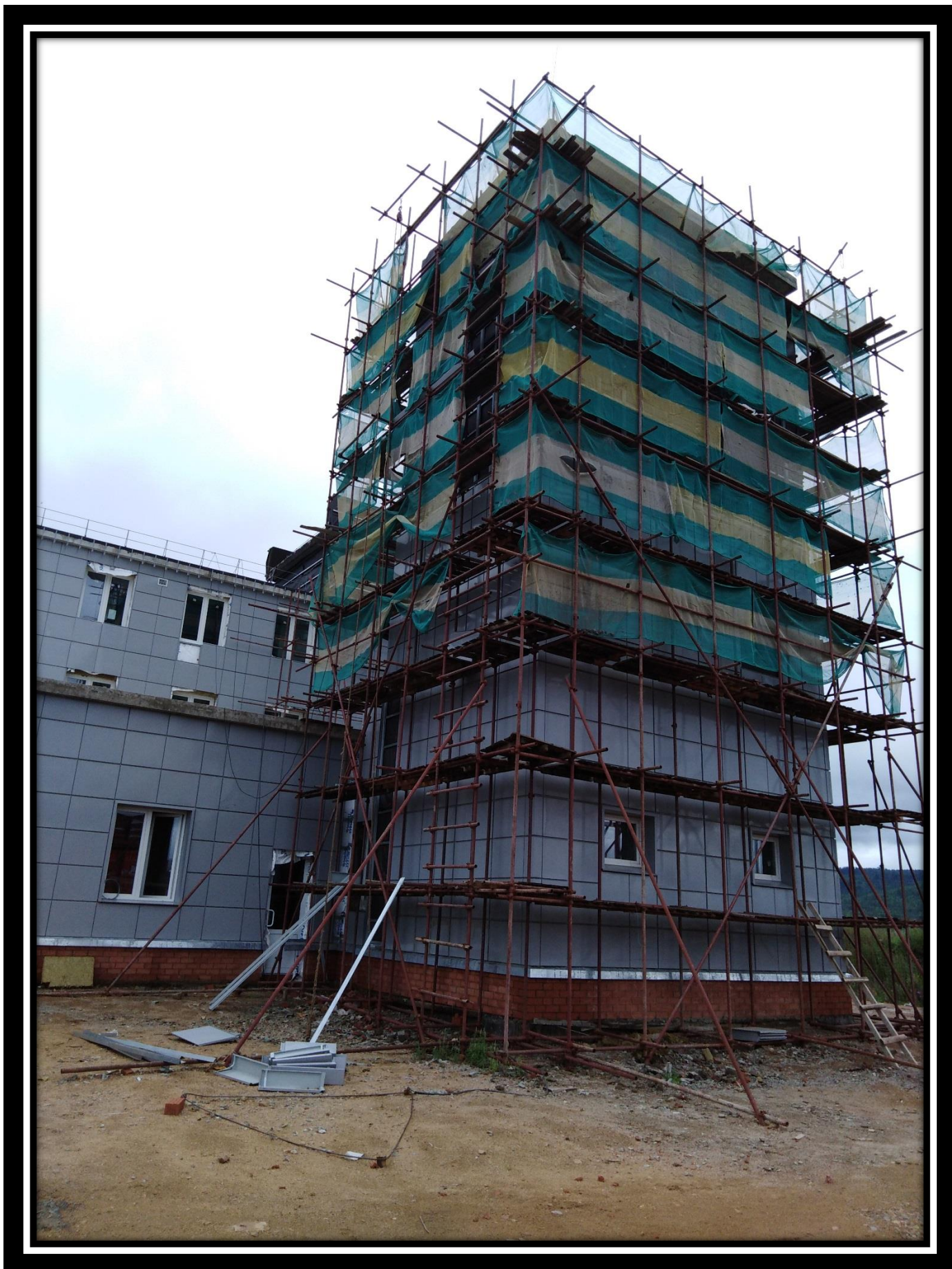
Башня сушки рукавов пожарное депо на 4 автомобиля. 30.06.18 г.