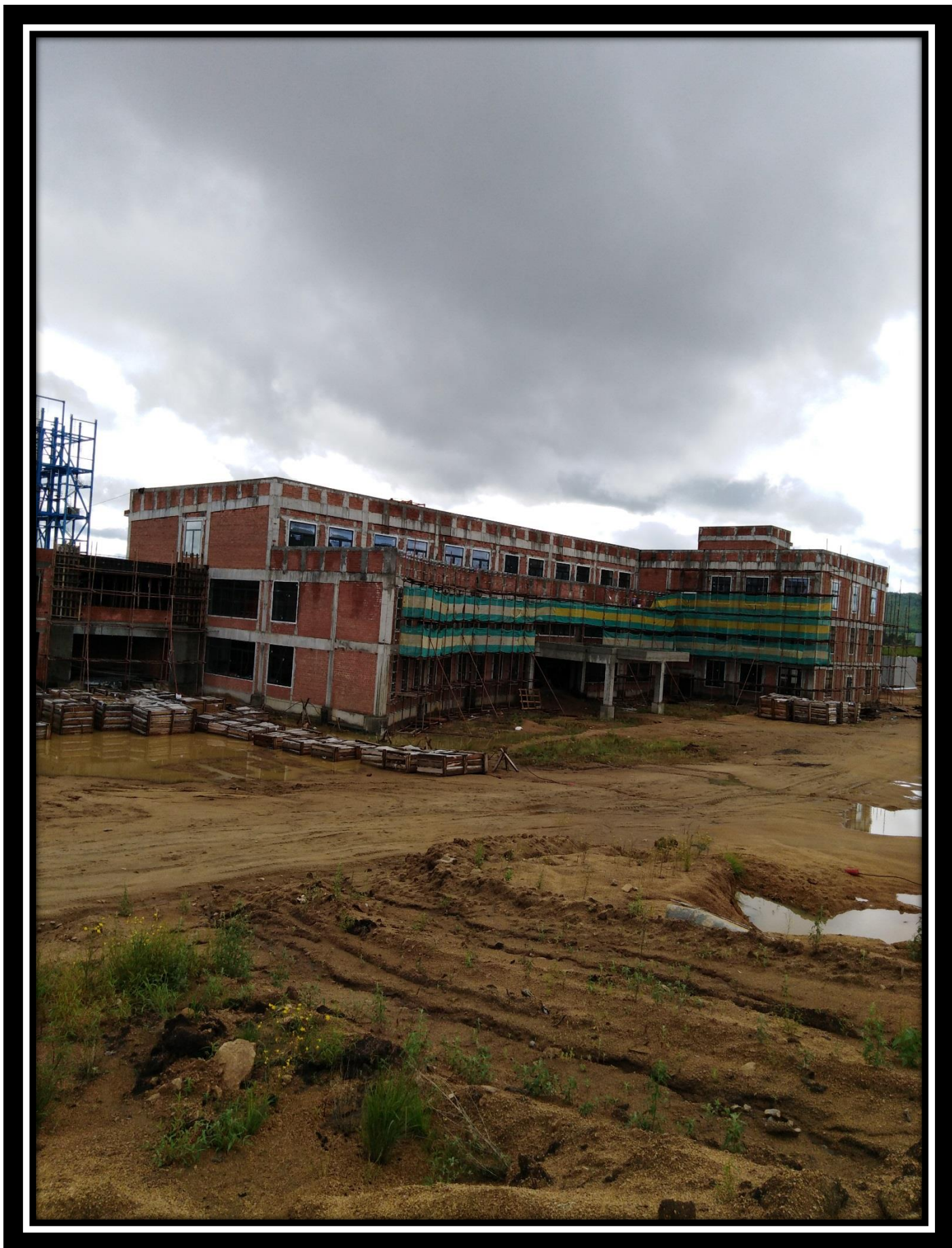
Административное здание 30.06.18 г.