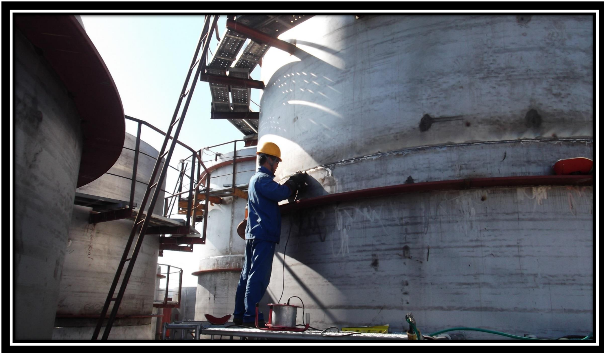
Сборка обечаек варочного котла 30.06.18 г.