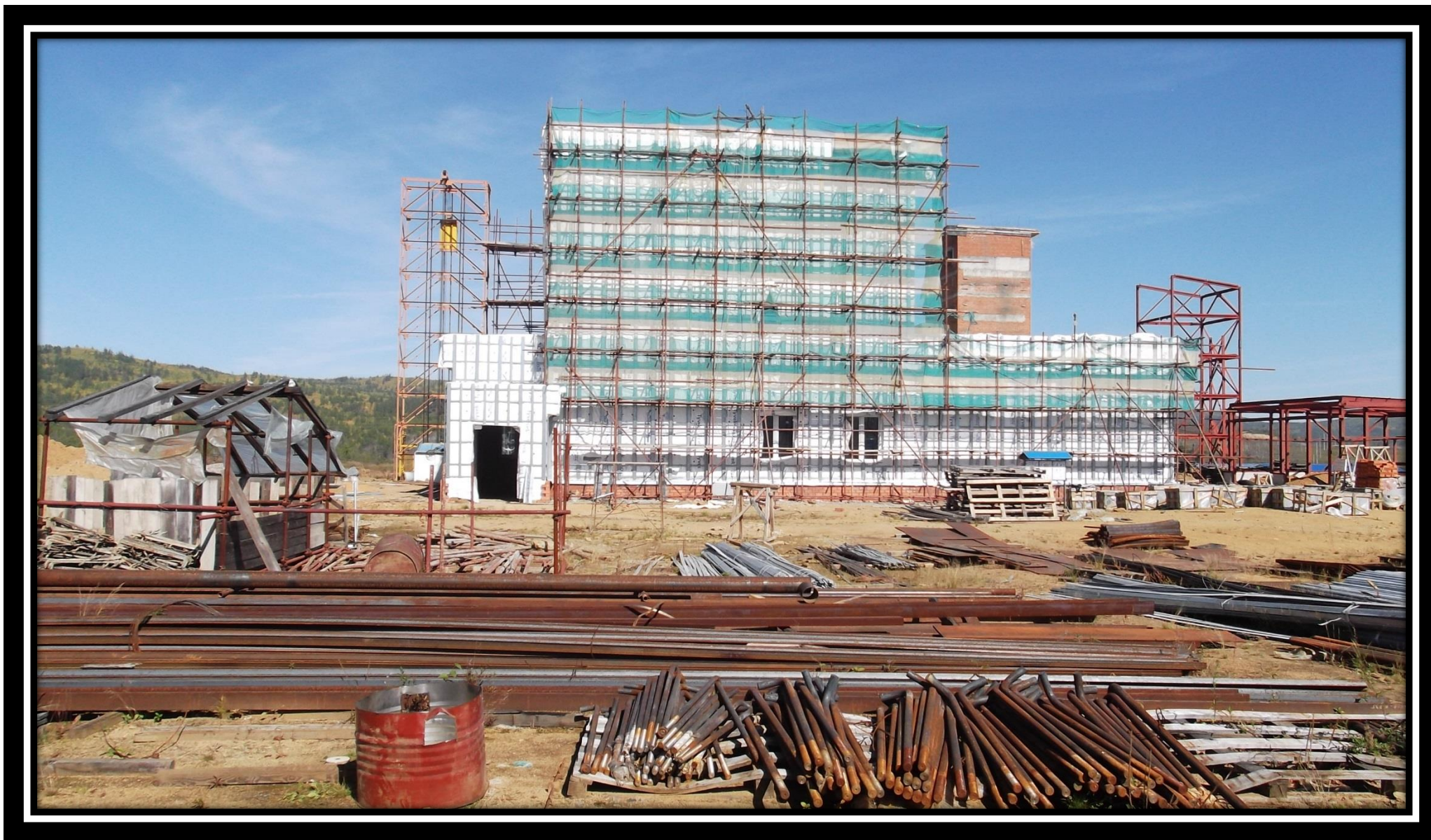
Пожарное депо на 4 автомобиля 30.06.18 г.