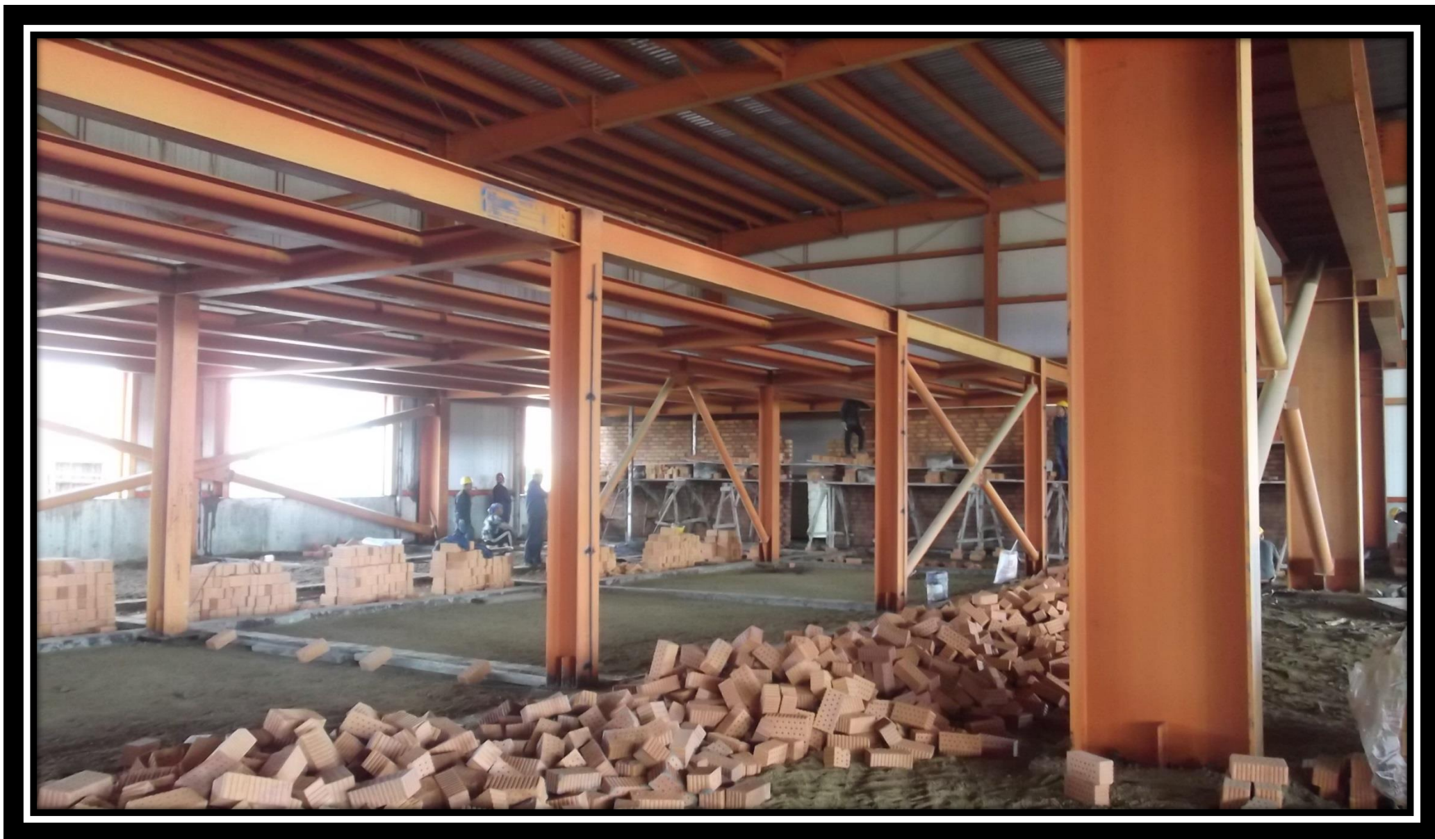
РММ Кирпичная кладка перегородок