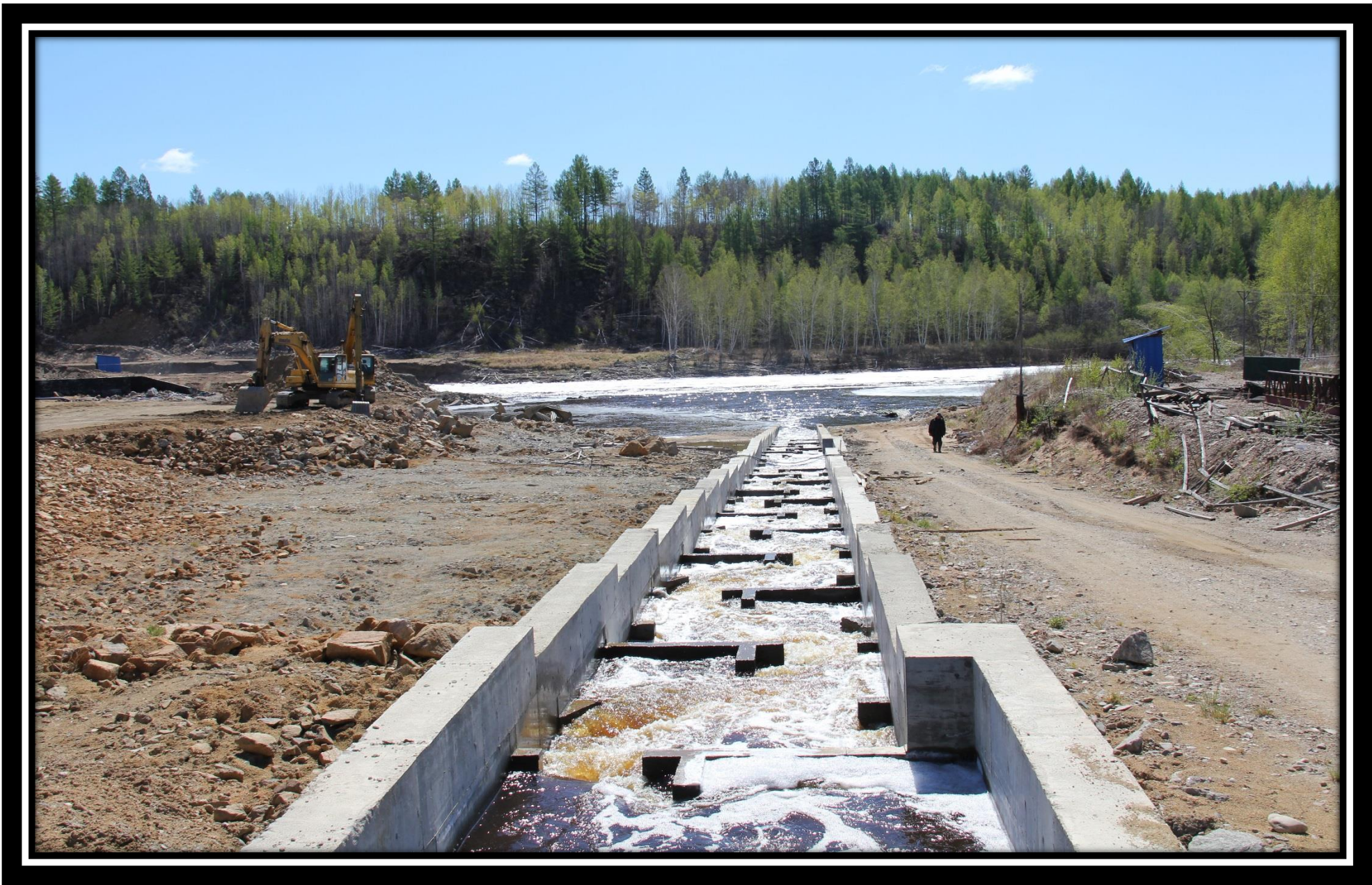
Рыбоход 30.06.18 г.