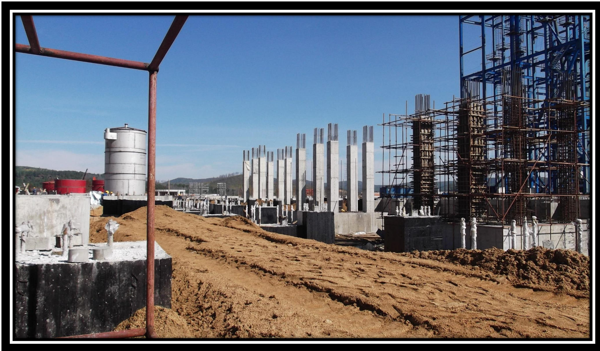
Фундамент энергетического хозяйства