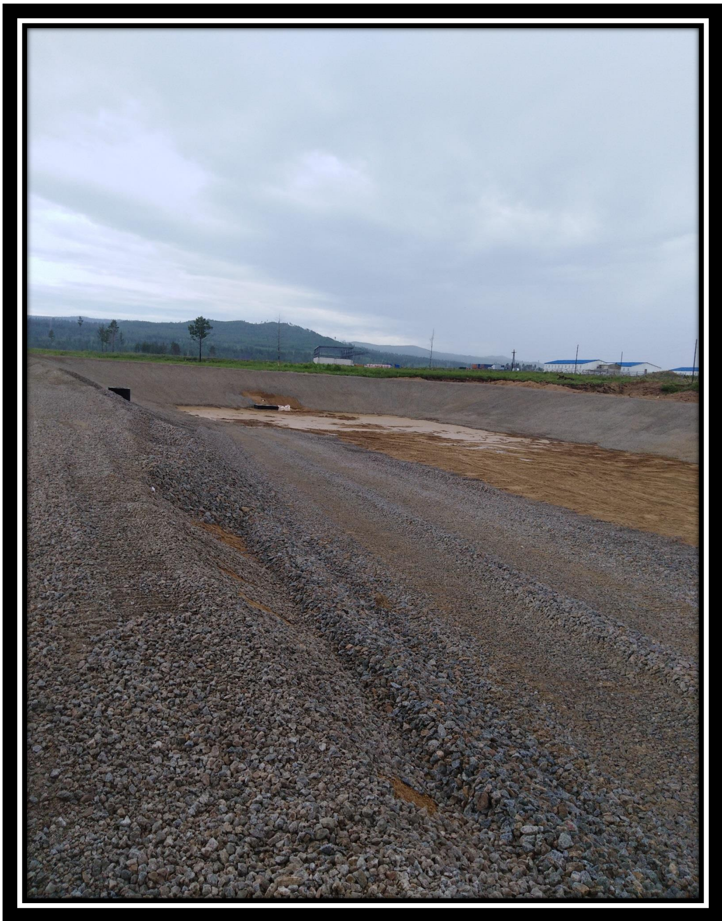
Отстойник дождевых вод 30.06.18 г.