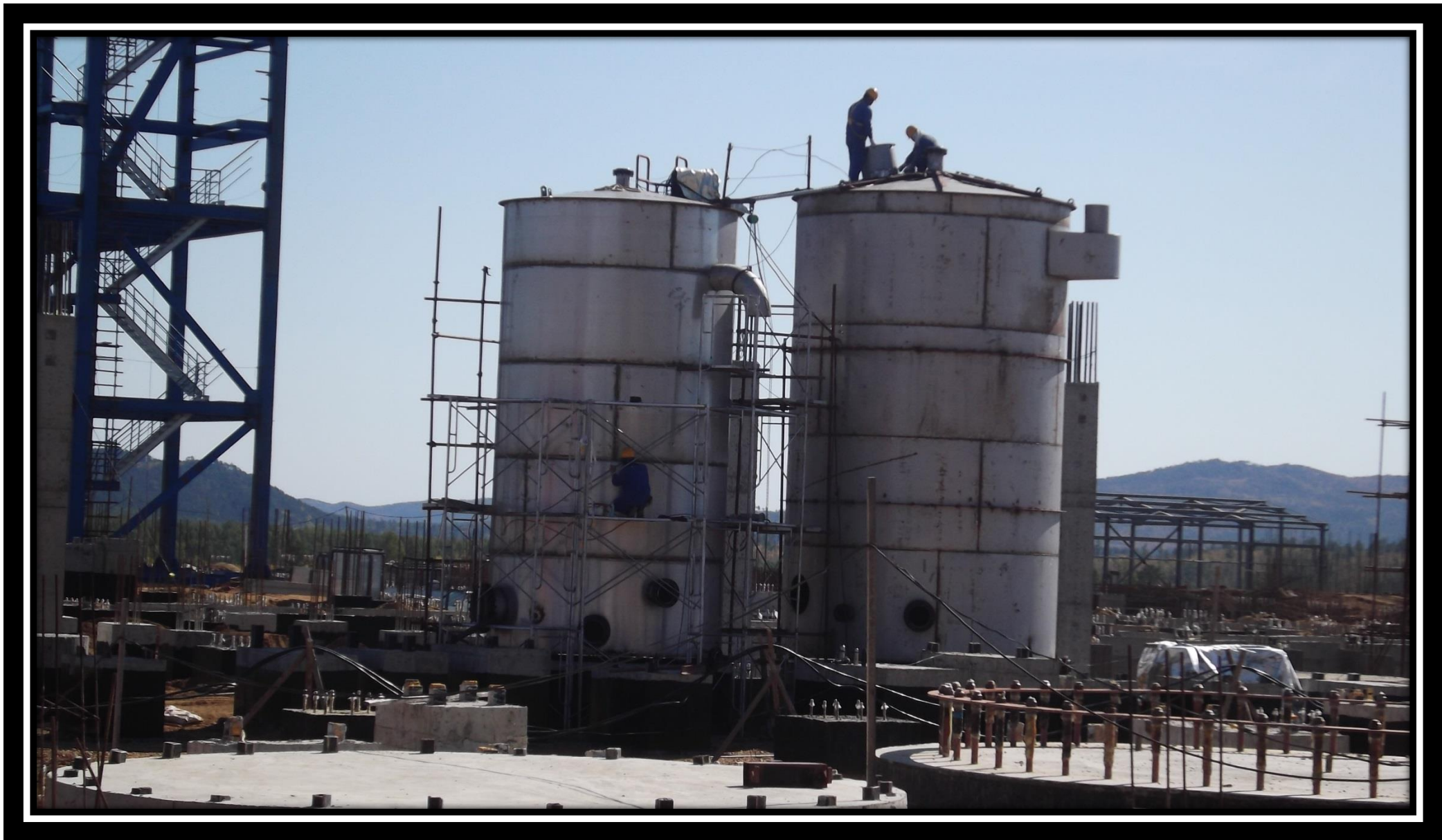
Емкости энергетического хозяйства