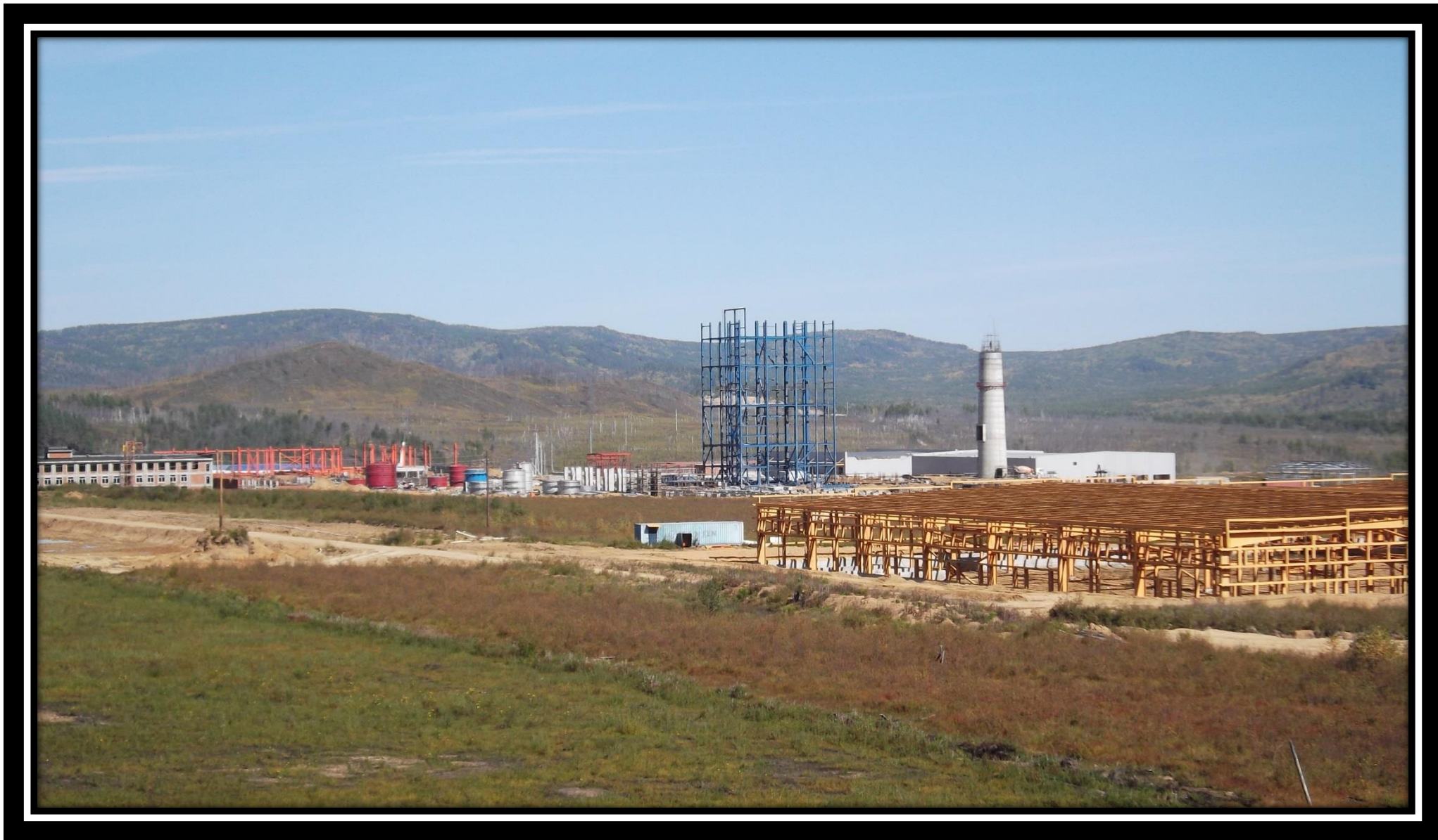
Пром-площадка 30.06.18 г.