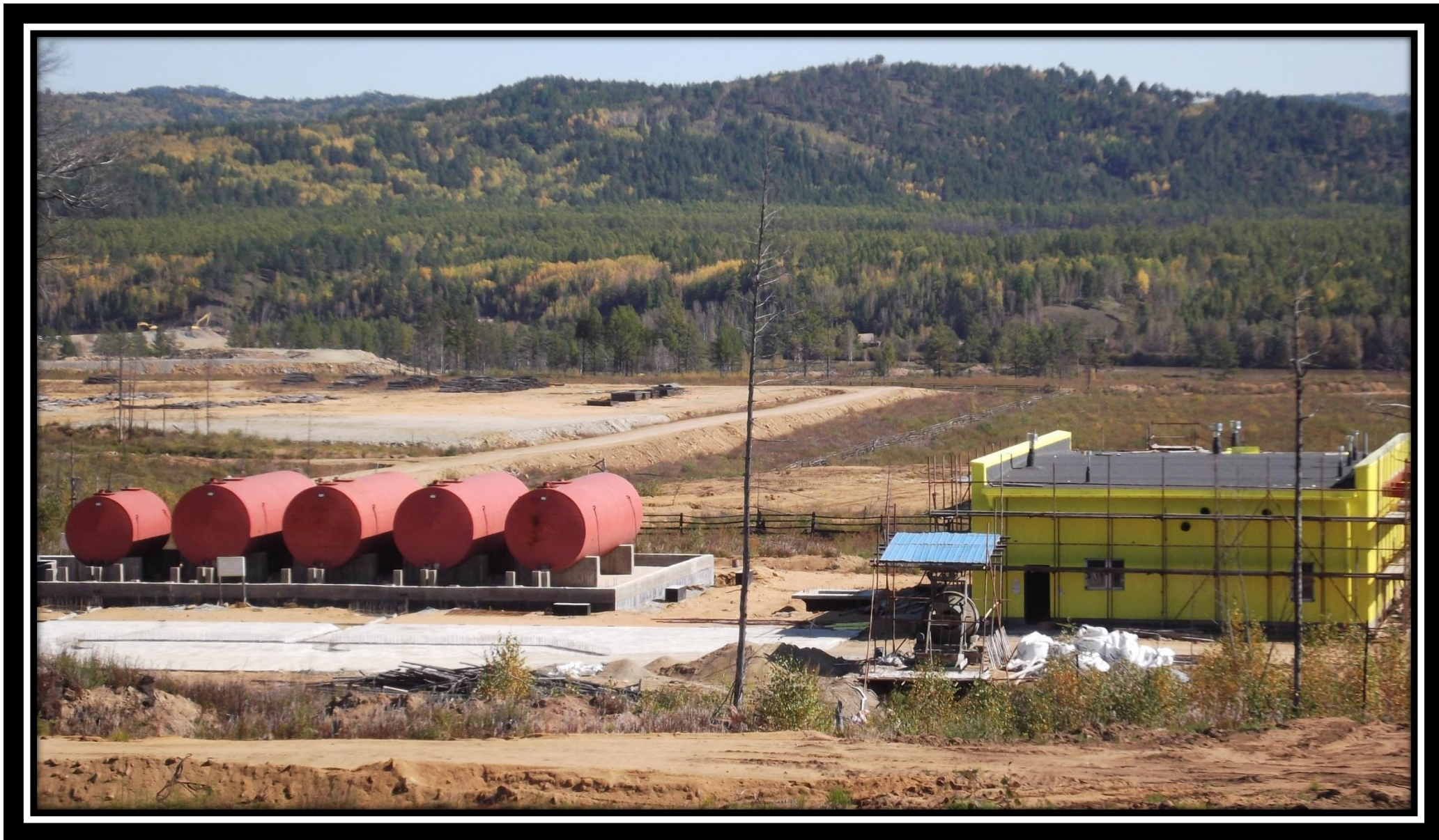
Склад ГСМ и ЛВЖ 30.06.18 г.