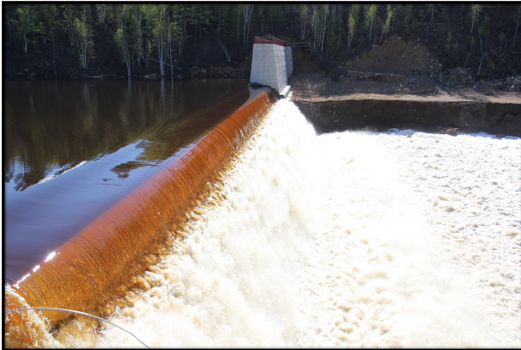
Гидроузел. Переливная плотина