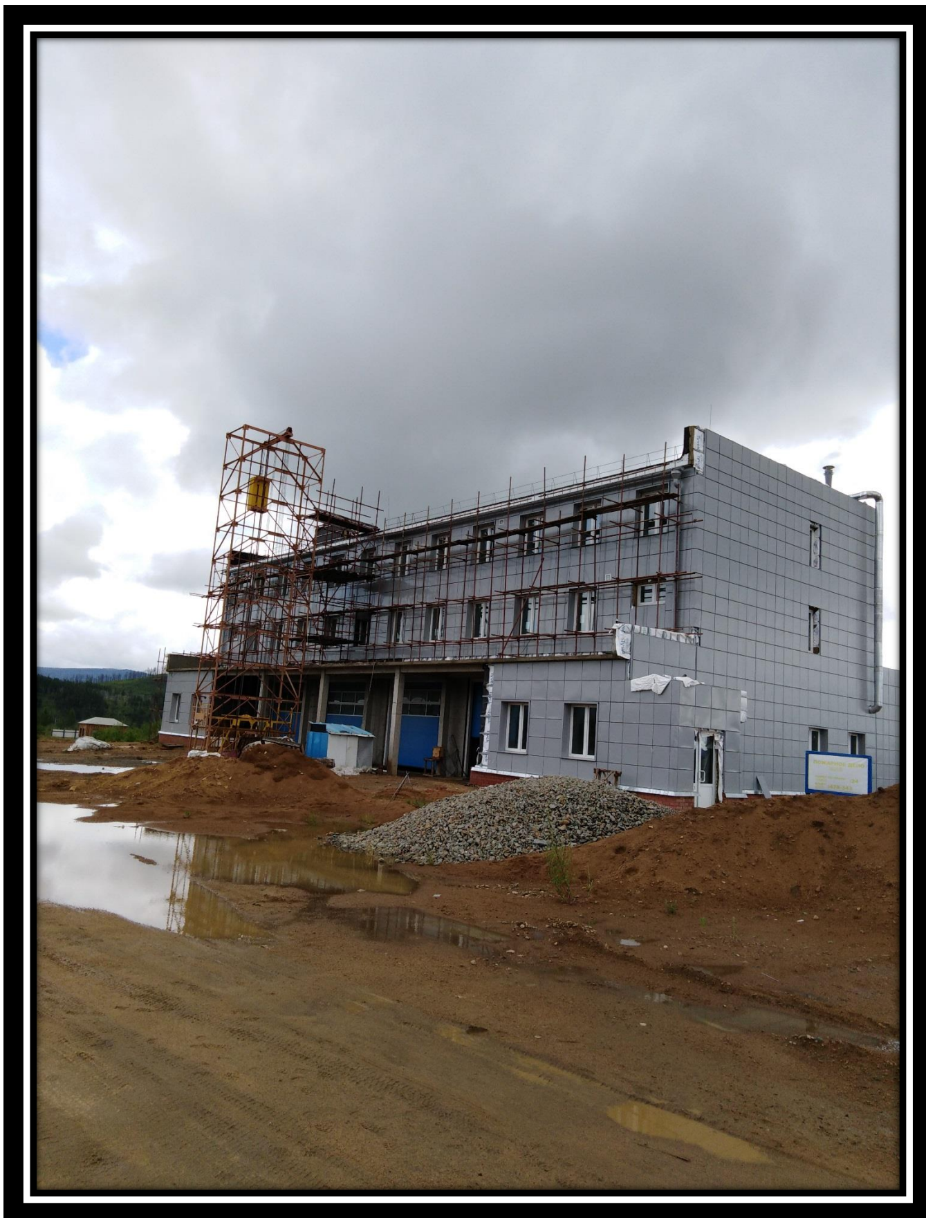
Пожарное депо на 4 автомобиля 2