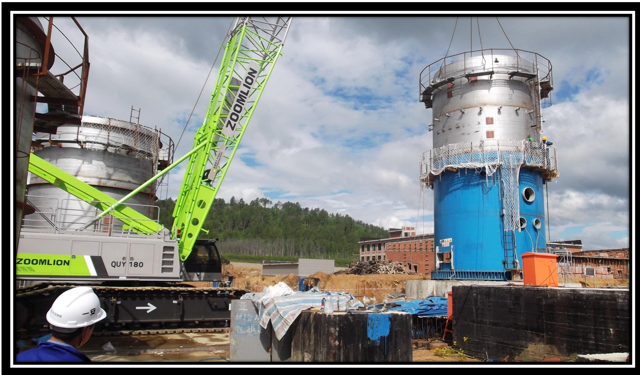
ВПЦ Монтаж варочного котла 30.06.18 г.