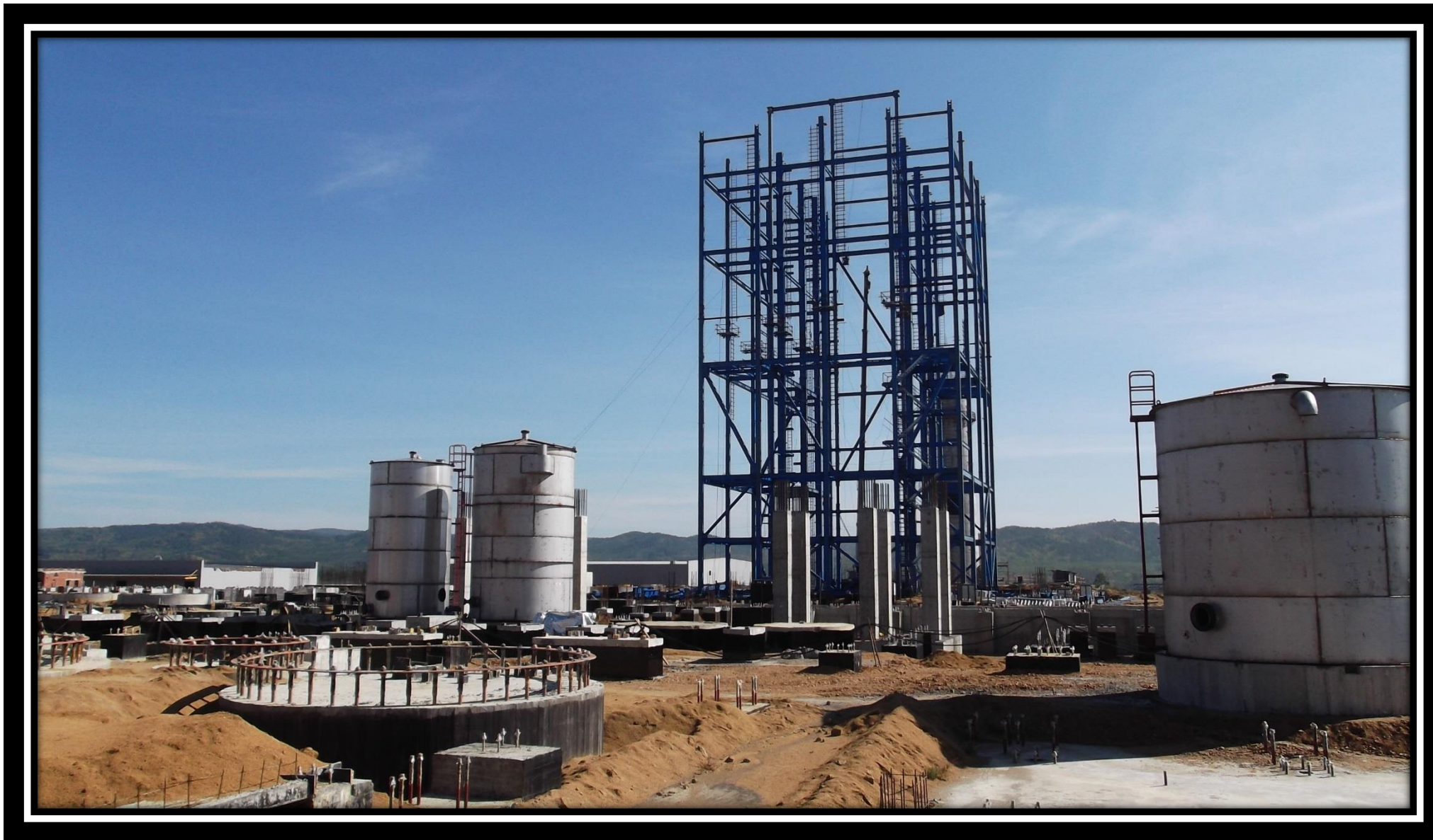
Монтаж оборудования 1 30.06.18 г.