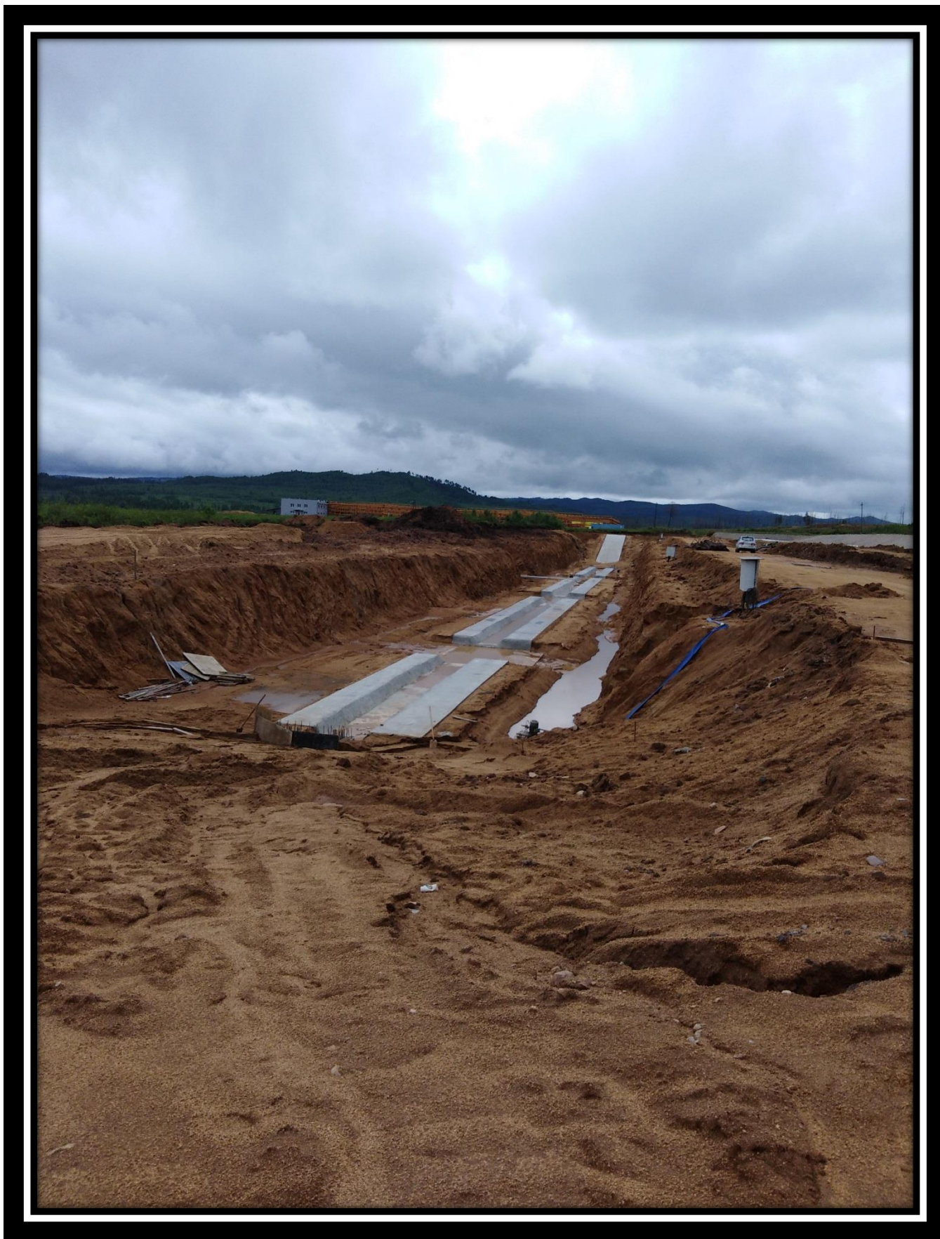
Склад щепы 30.06.18 г.