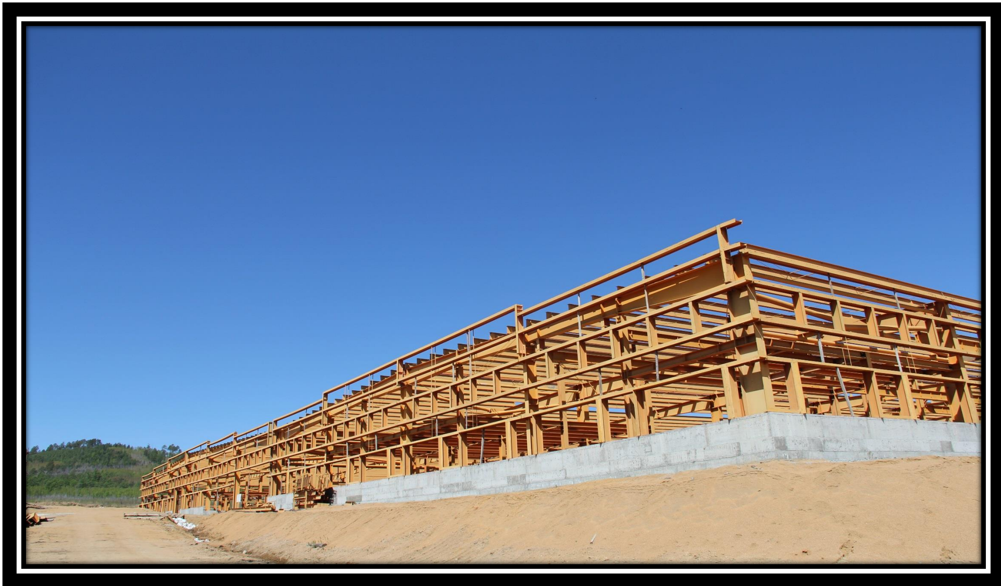
Автотранспортный цех 30.06.18 г.