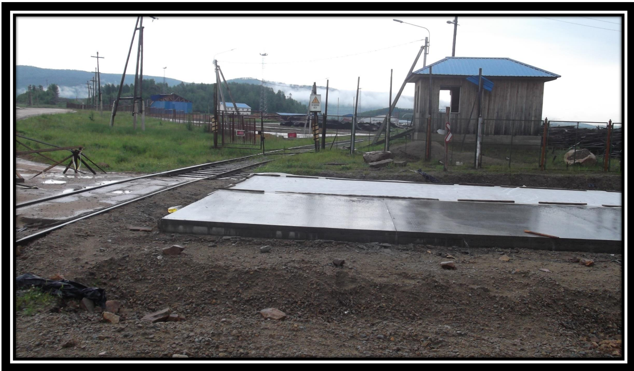
Устройство дороги в поселок