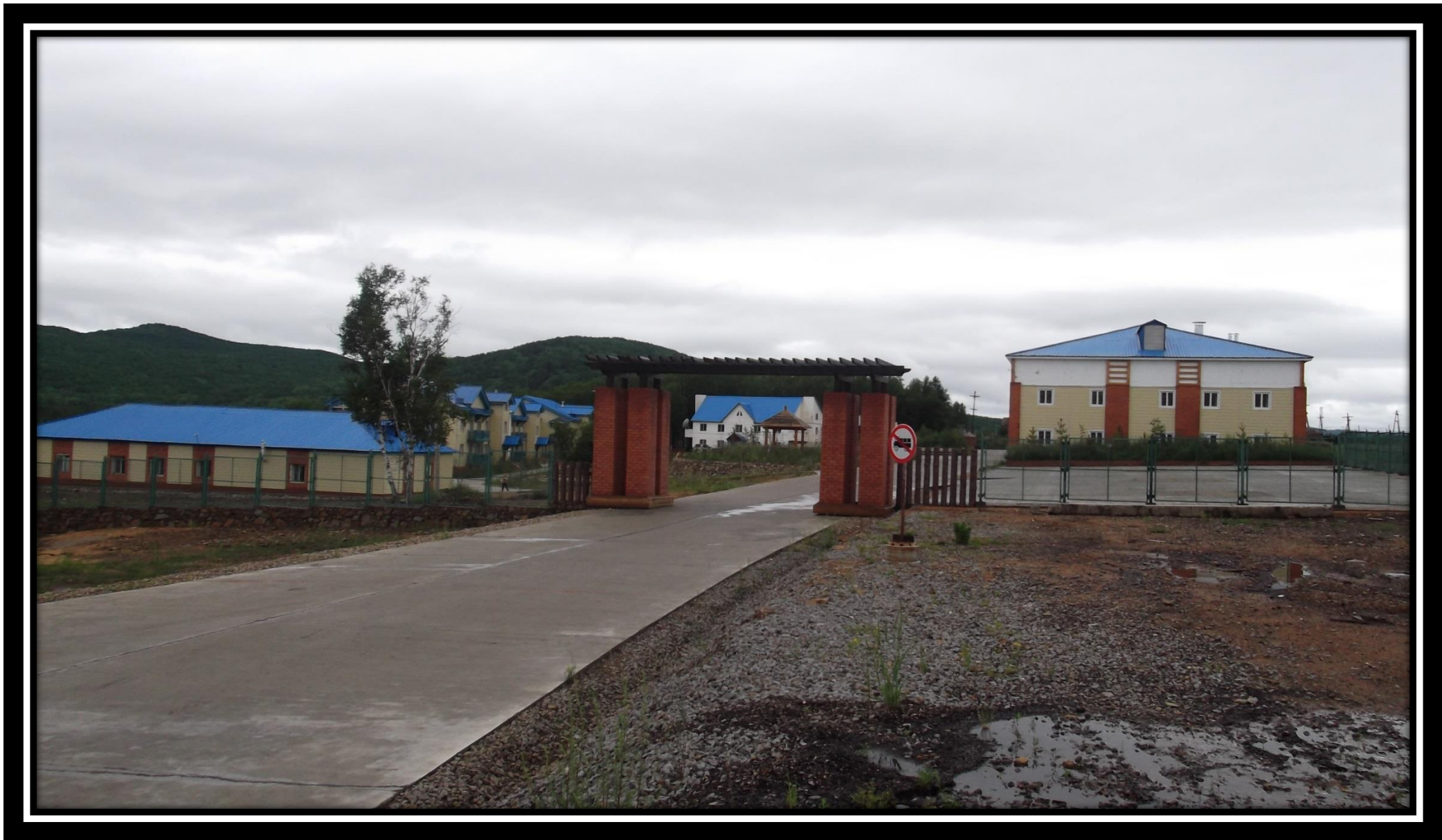
Жилой микрорайон 30.06.18 г.